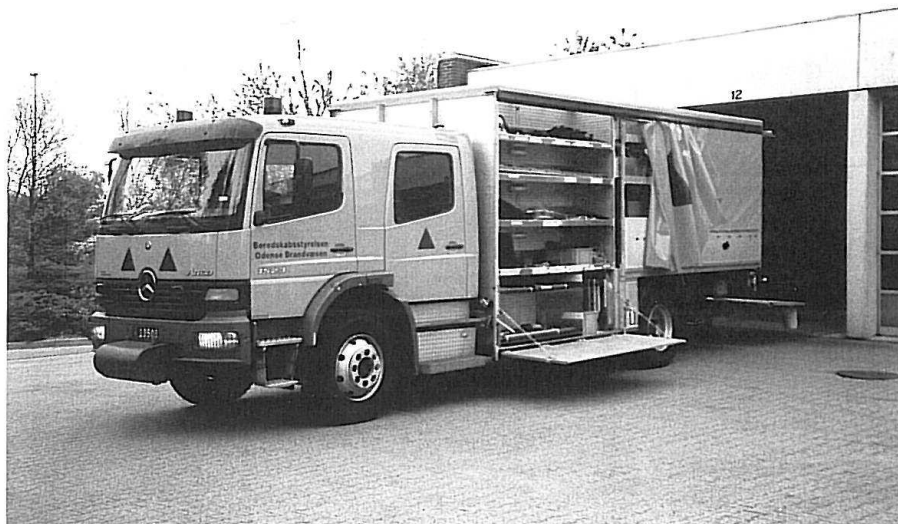
STP Odense. Delvist udpakket svær redningsvogn på MB 1523 Atego med dobbeltkabine.

Alle støttepunkterne råder over en trailer med VW/Bauer-højtrykskompressor til genfyldning af trykluftapparater. Disse enheder er hentet fra Beredskabskorpsets mobiliseringsdepoter og er således ikke nyindkøb. Endvidere er der til visse støttepunkter indkøbt en trailer, fabrikat Swede Cargo, med materielrensepladsudstyr. Hvert støttepunkt råder desuden over en Ibericia-trailer med 9 m lysmast, fabrikat Himoinsa, der yder 1500 kW og senere er også en større generatortrailer kommet til.