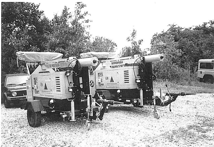
STP Aalborg og Nykøbing Falster. Himoinsa Lysmast på trailer.