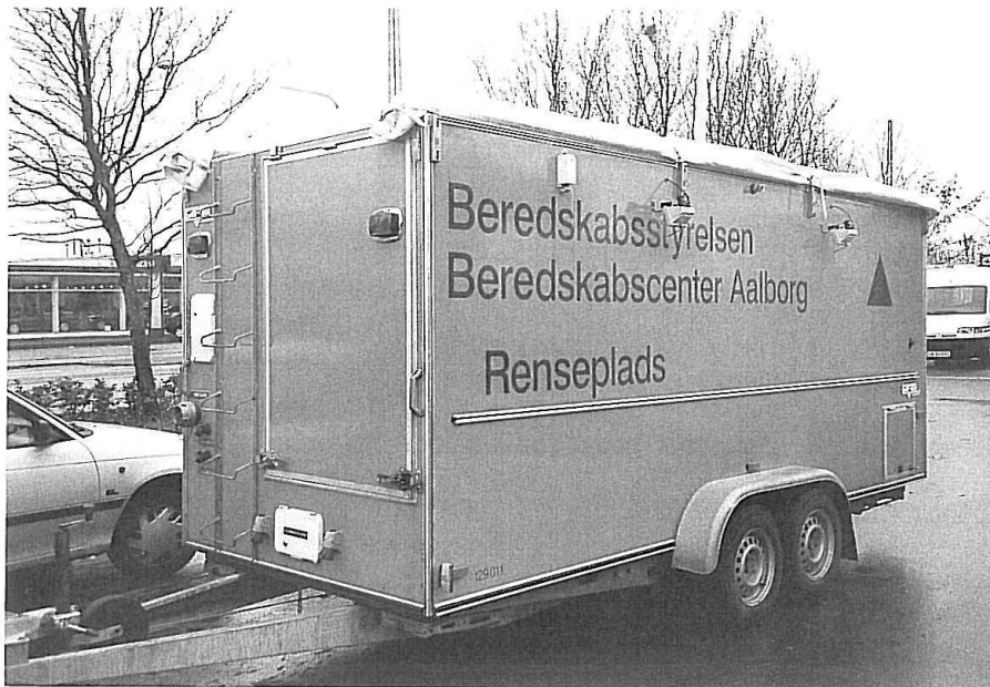
STP Aalborg. Rensepladstrailer.