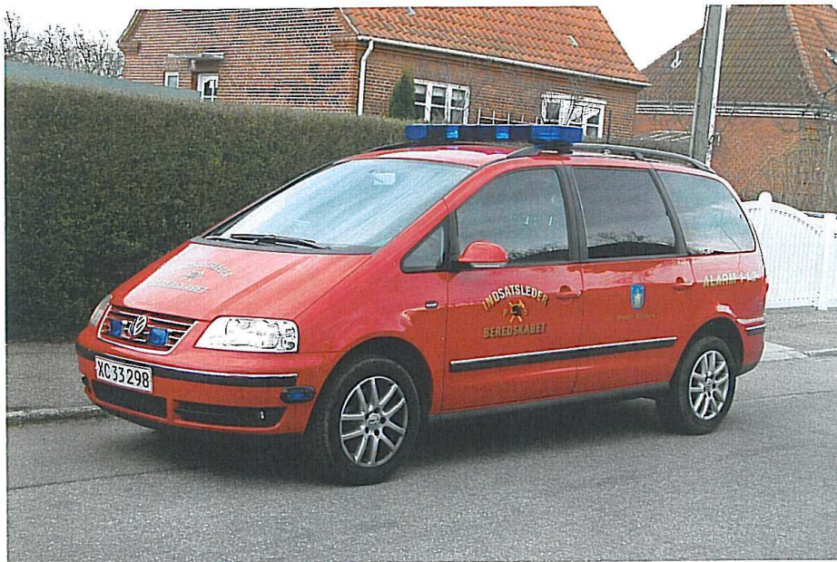
Brøndby Kommunes indsatsleder P-5, VW Touran.