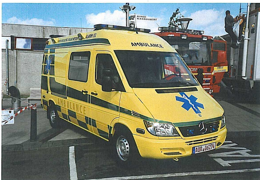
Frederiksberg A 2, MB 316 CDI Sprinter II, Hospimobil (D)