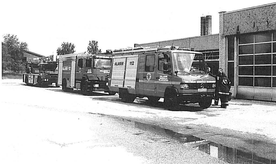
Køretøjerne afventer signal før fremkørsel til fotografering.

Læs også artiklen i VMF 2/05 om Hørsholms opstart m.m.