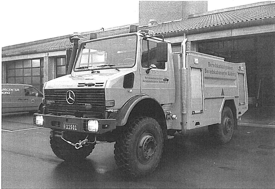
STP Aalborg, MB Unimog 2150 L, 4500 liter, 1600 l/m-pumpe, 2400 l/m-vandkanon.

Billedet ovenfor viser Støttestpunkt Aalborgs terrængående 4500 liter-tankvogn på Unimog-chassis.