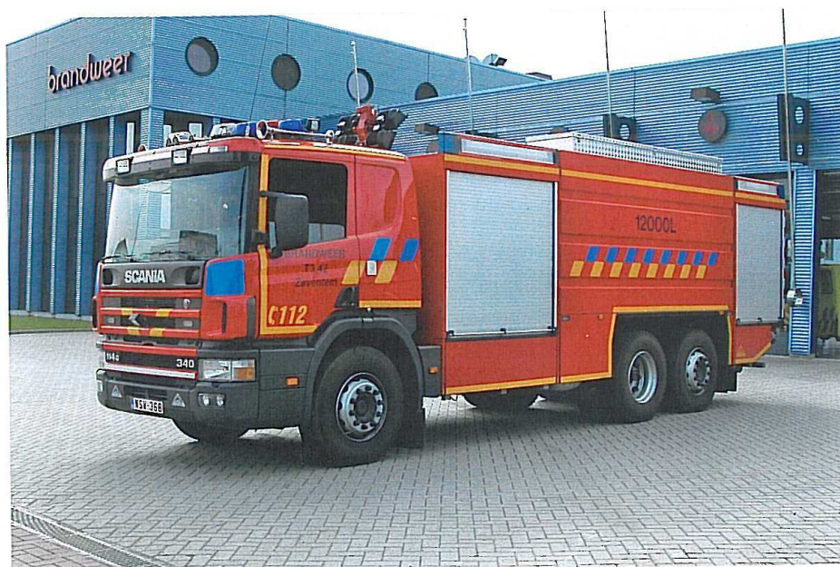
Scania P-114G tankvogn fra Brandweer Zaventem med en 12000 liter vandtank.