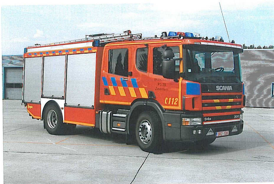
Scania sprøjte(P3.39 autopomp) fra 2002. Brandweer Zaventem i Belgien.