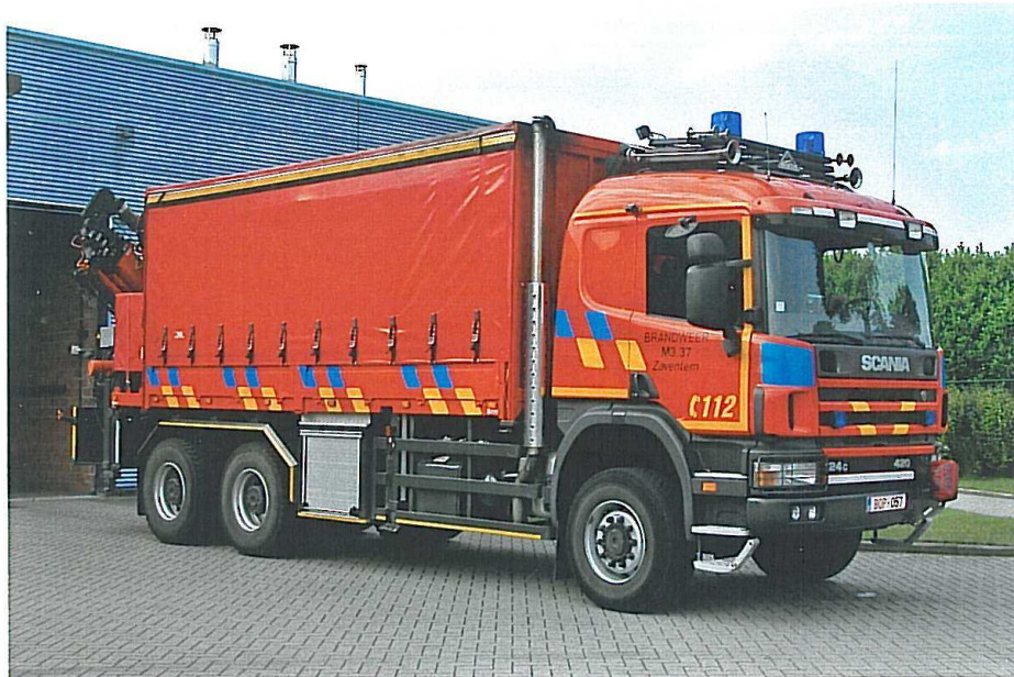
Materiaalwagon (redningsvogn) Scania P-124 CB 6x6 420 HK 2001.