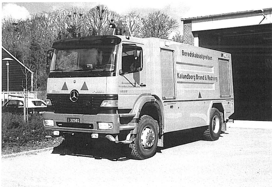
STP Kalundborg, MB 1828 Atego, 8000 liter, 2800 l/m-pumpe, 2400 l/m-vandkanon.

Der blev indgået kontrakt med Ringe Karrosseri om opbygning af 6 vandtankvogne til støttepunkterne. Planen var at udstyre alle 7 støttepunkter med en 8000 liter vandtankvogn på Mercedes Benz 1828 Atego-chassis, men Odense ønskede ingen vandtankvogn fordi man mente sig godt dækket ind i forvejen med 3 store tankvogne i byen. I Aalborg havde man ligeledes 3 tankvogne og så derfor ikke noget umiddelbart behov for endnu en – men man ville gerne have en specialtankvogn med bedre køreegenskaber i klit- og plantageområder, som der jo er mange af i Nordjylland.