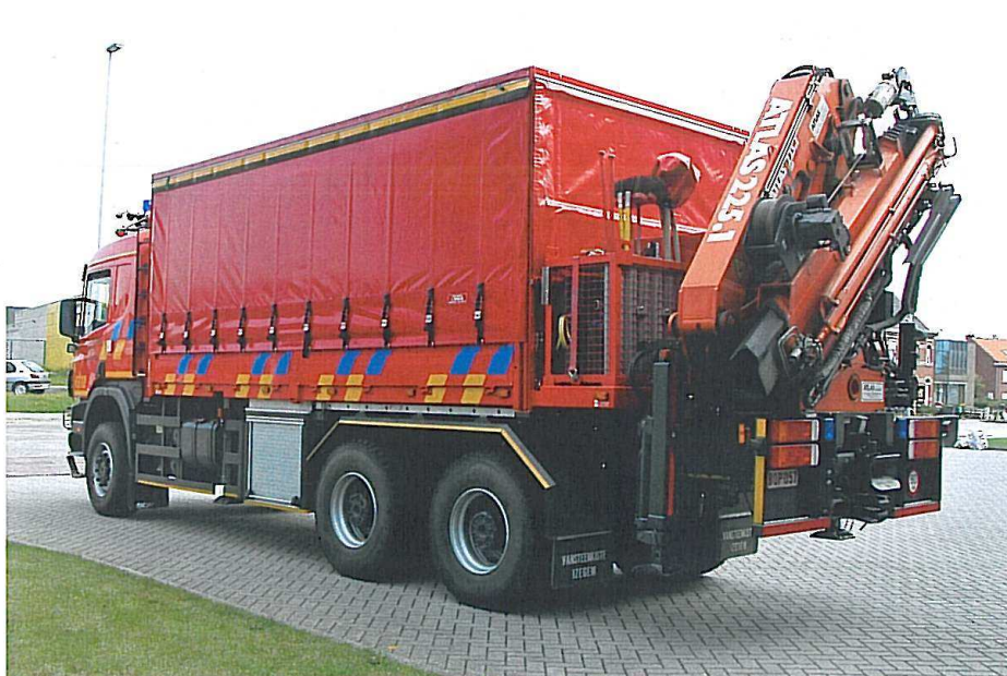
...og her set bagfra. Mere info næste side.