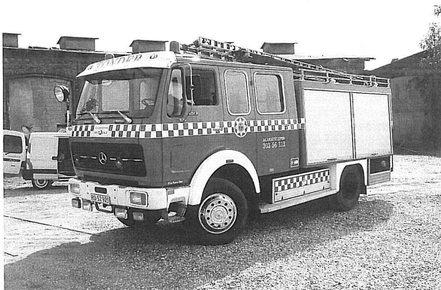
Tønder Campings sprøjte. En MB 1017 4x4 fra 1977. Ex Holland og Vallø Stevns beredskab. Bemærk alarm nummeret, 30356112 !!! Foto John Hou.