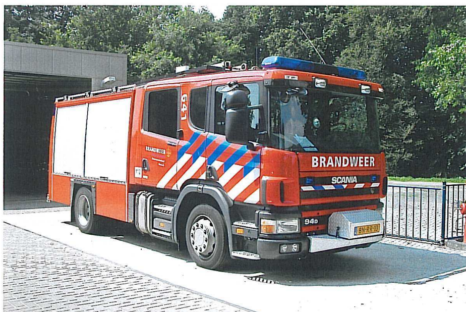
Sidste Scania fra Holland er en P 94D med 230 HK fra Brandweer Hasselt.