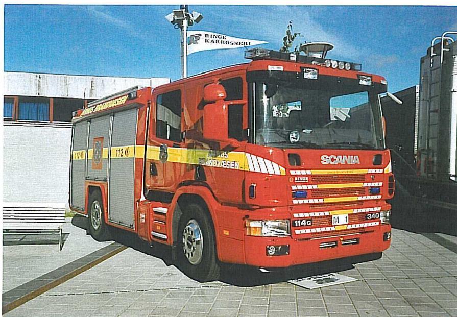
Århus M 1, Scania P 114.