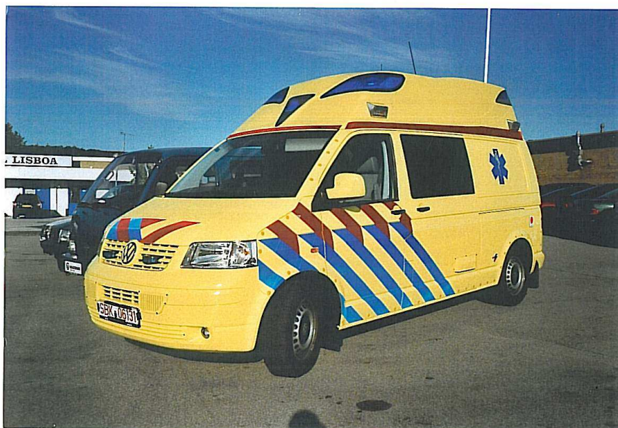
Ambulance, VW Transporter T5 TDI, Visser (NL)