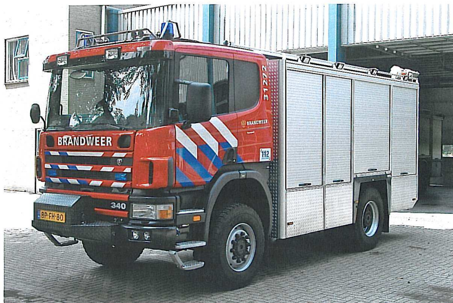
Pionervogn fra Brandweer Nunspeet i Holland. En Scania 114c 4x4 fra 2004.