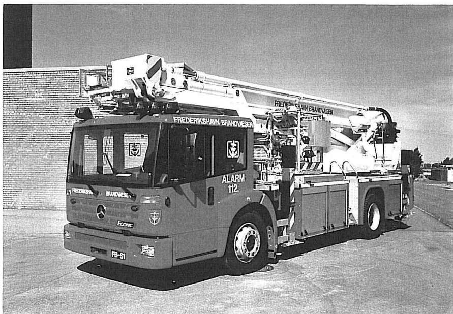
Ny FB-4, MB 1828 Econic, Bronto F 32 RL.