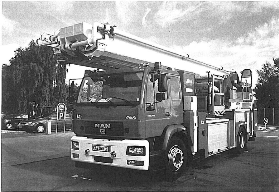
Metz-redningslift B 32 på MAN LE2000-chassis.