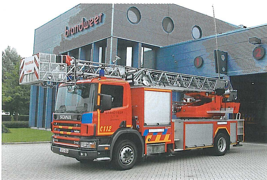
Scania P-114G, 30 meter drejstige med knæk. Opbygget af Magirus og Rosenbauer i 2001. Brandweer Zaventem.