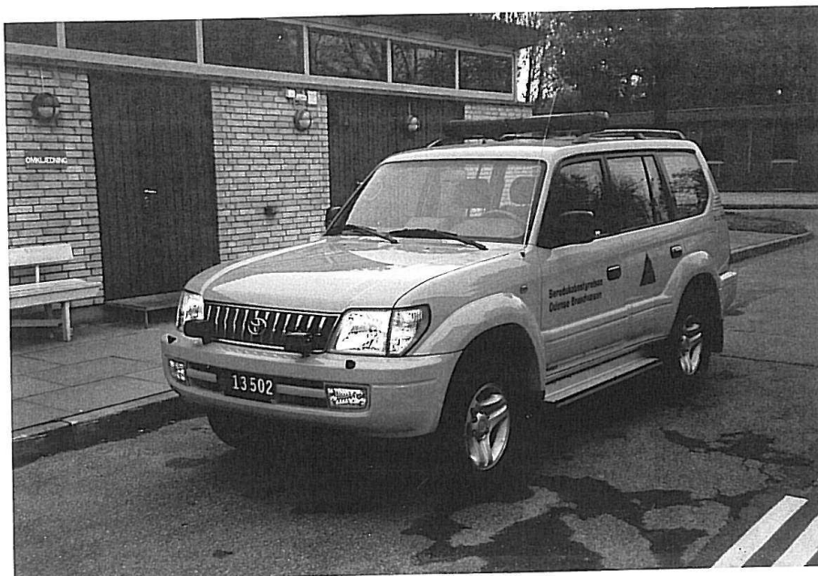
STP Odense. Toyota Landcruiser GX90 til fremførsel af påhængsvogne

I 2003 blev støttepunktsberedskaberne i Fredericia, Kalundborg, Århus og Esbjerg udvidet med en svær redningsvogn i stil med Odenses, men denne gang på IVECO 120E18 Tector-chassis, idet IVECO på daværende tidspunkt havde en rammeaftale med Beredskabsstyrelsen om levering af lastvognschassis i klassen under 16 tons.