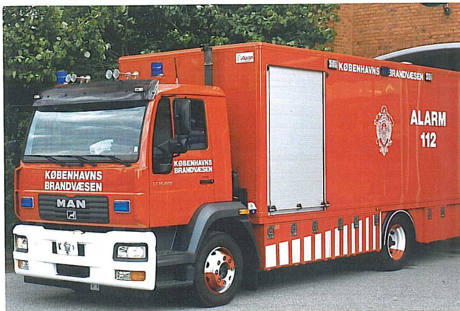
Københavns Brandvæsens nye følgeskadevogn K-1, MAN LE 12.220, som kører fra St. D og afløser en ældre Ford Transit.