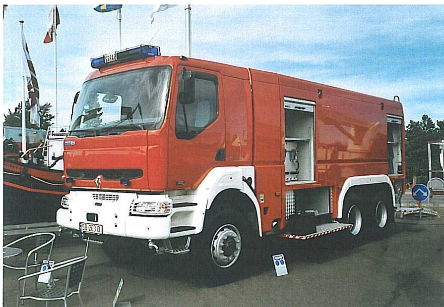
Renault-tanksprøjte fra Wawraszek/Hauberg.