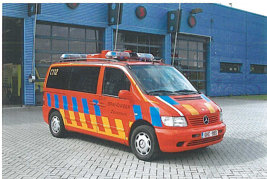
Commandwagon. Mercedes Vito 110 CDI fra 2001. Brandweer Zaventem.