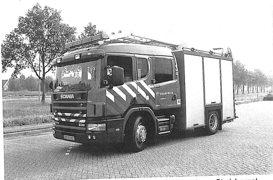
Scania sprøjte fra 2004 med Godiva pumpe. Brandweer Stadskanaal.