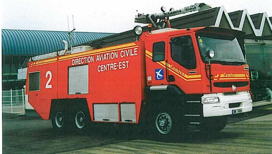
Og så lige en lufthavnsbrandbil fra Grenoble i Frankrig.