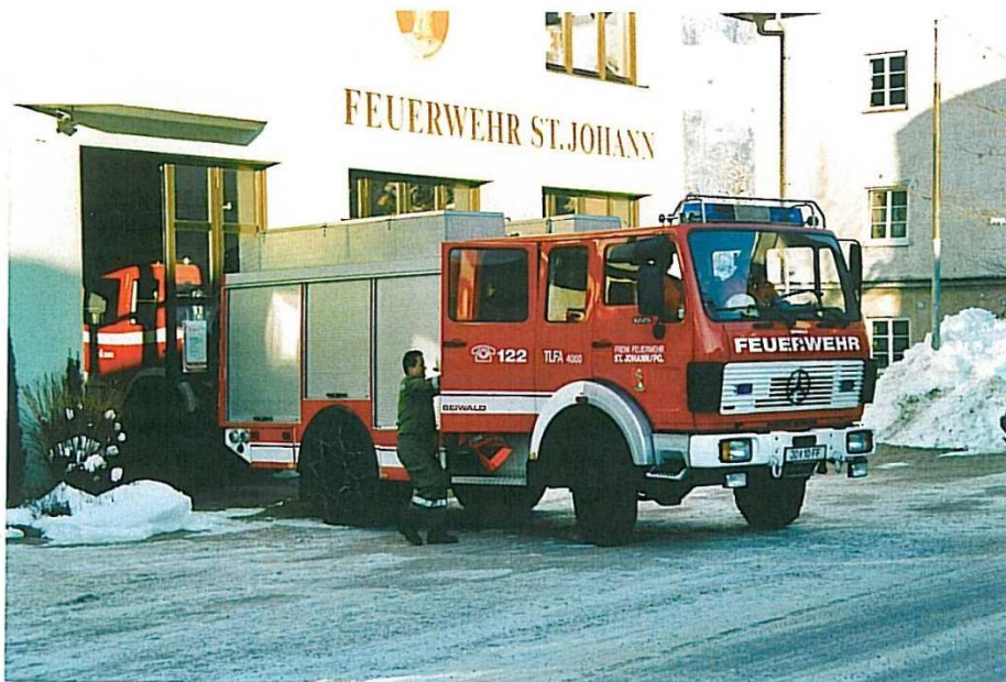
En ren foræring... der indløb en brandalarm da undertegnede befandt sig ved brandstationen. MB1225/Seiwald tanksprøjte, Østrig.