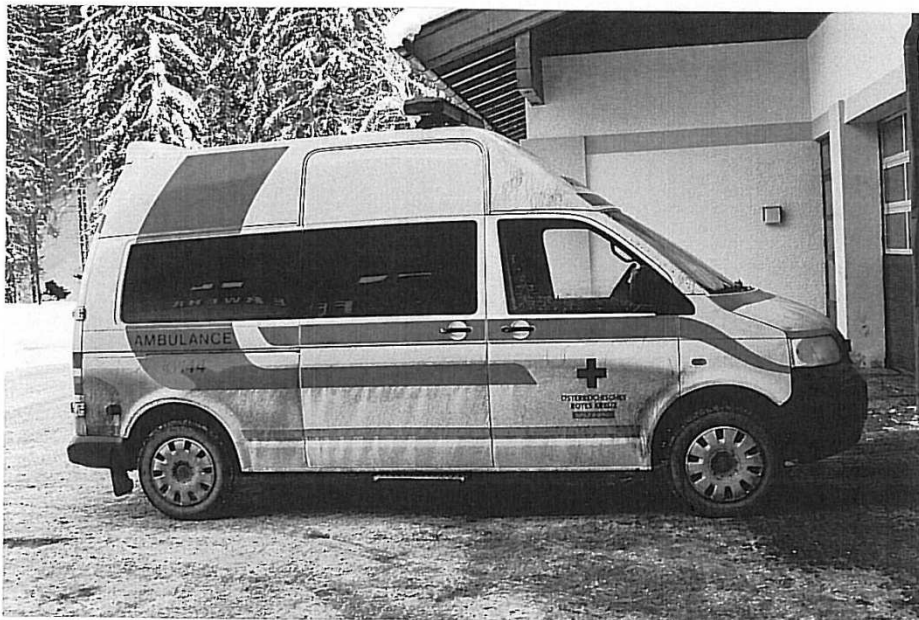
Beskidt ambulance hos Røde Kors i Saalbach, Østrig.