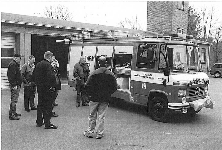
Slagelse R-1 bliver beset af medlemmerne.

Slagelse Brandvæsen har en rigtig flot hjemmeside på www.slagelseredningsberedskab.dk . Her er der bl.a. mulighed for at se deres nye tankvogn og pionervogn m.m.