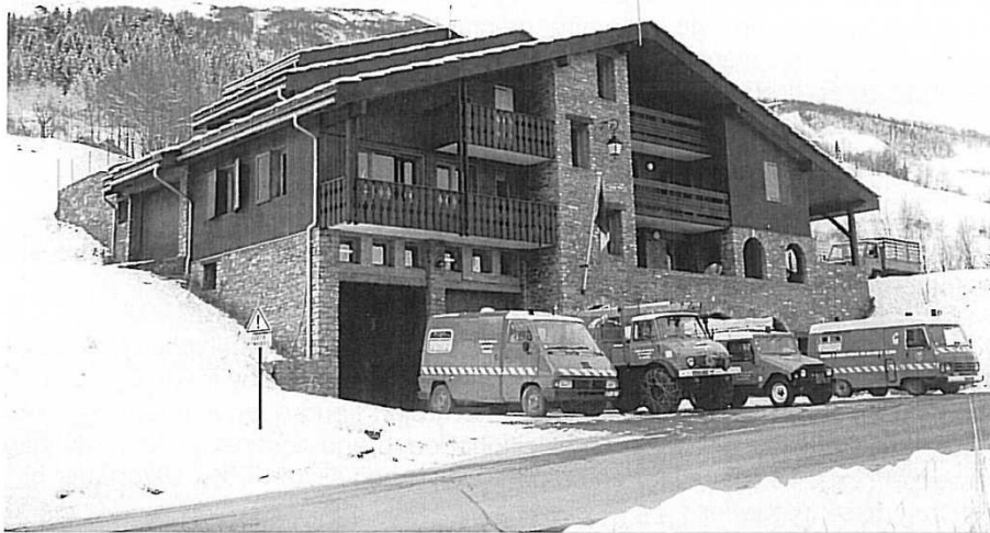
Centre de Secours de Montagne i Franske Valmorel, 1996.