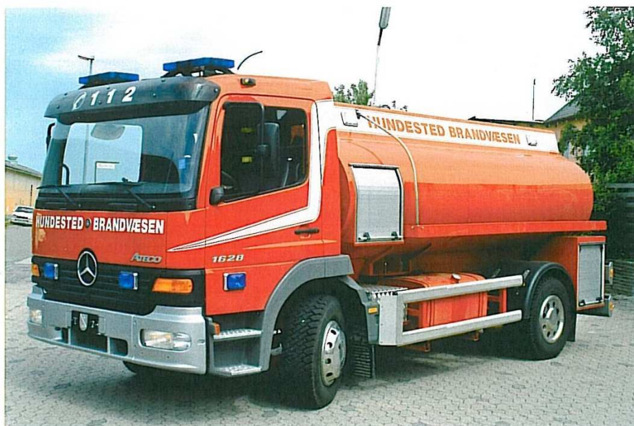
Hundested Brandvæsen T-2 MB 1628 Atego.