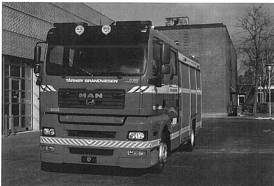
Tårnby Brandvæsen M-3.

I mandskabsrummet er der plads til fire røgdykkere, hvoraf de tre har originale Rosenbauer-sæder med nakkestøtte. Den fjerde røgdykker sidder på et klapsæde med ryggen i køreretningen (benyttes sjældent). Brandmesteren har et lille "kontor" med udfoldbar skriveplade og plads til diverse mapper, ligesom han har to Niros 3001 radioer til henholdsvis alarmcentralen og til egen vagtcentral. Chaufføren har til sin hjælp et bakkamera og et cyklistkamera, ligesom der er indbygget en lille projektør under højre fordør, der oplyser nærzonen, når der manøvreres i mørke.