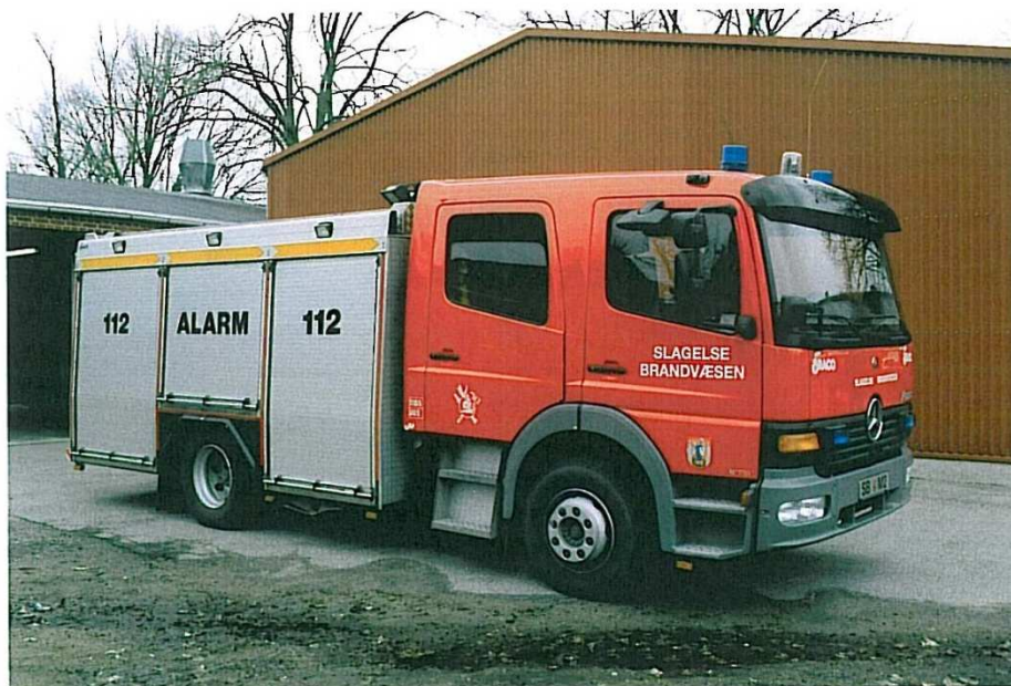
Slagelse M-2, Mercedes Benz Atego fra 2000.