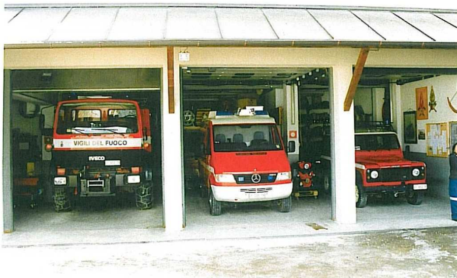
I Canazei, Italien var jeg knap så heldig, og måtte nøjes med at få portene op. Fra venstre skovbrandbil, pionervogn og færdselsvogn.