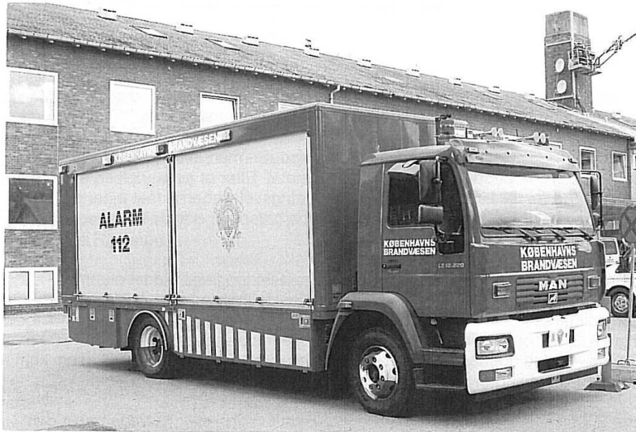
Ny "gulvkludebil", K 1, MAN LE 12.220.