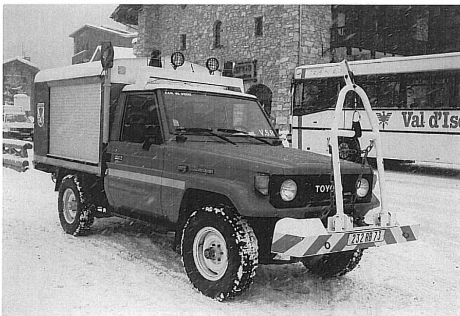
Toyota Landcruiser pionervogn i Val d'Isère, Frankrig.

Hvis der er mere end 3 huse i en by, har de også en brandbil har jeg hørt... Det gælder ikke mindst i mit favorit ski-land Østrig, hvor der i en lille hyggelig by med 1000 faste indbyggere var 45 aktive deltidsbrandfolk og 7 køretøjer. I andre lande findes en slags "satellit-byer" der nærmest er banket op til lejligheden, brandvæsenet vil så sædvanligvis være garageret i en p-kælder eller i en carport. Det er helt sikkert IKKE Utzon, der er arkitekten bag disse byggerier.