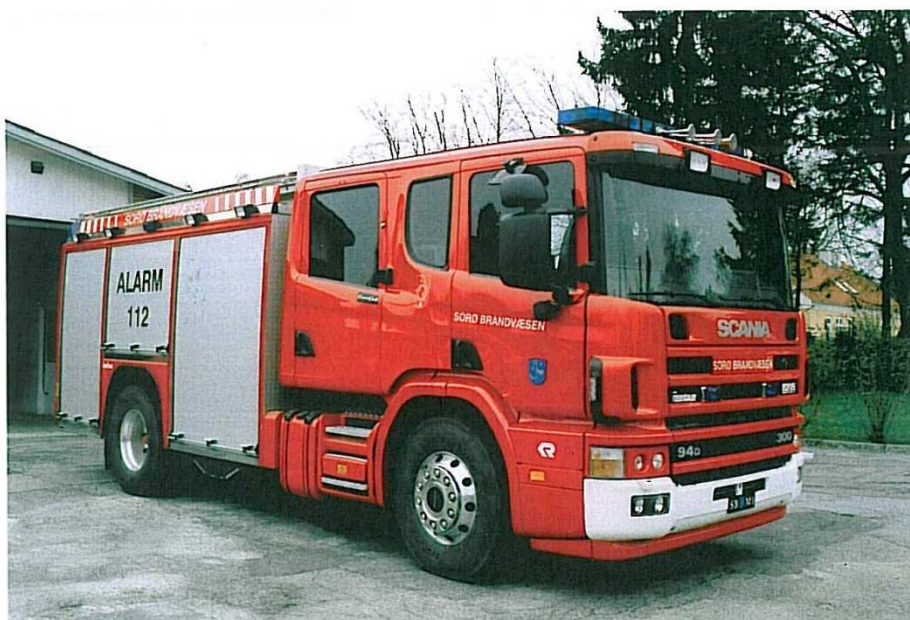
Sorø M-1, Scania 94D med den store hytte.