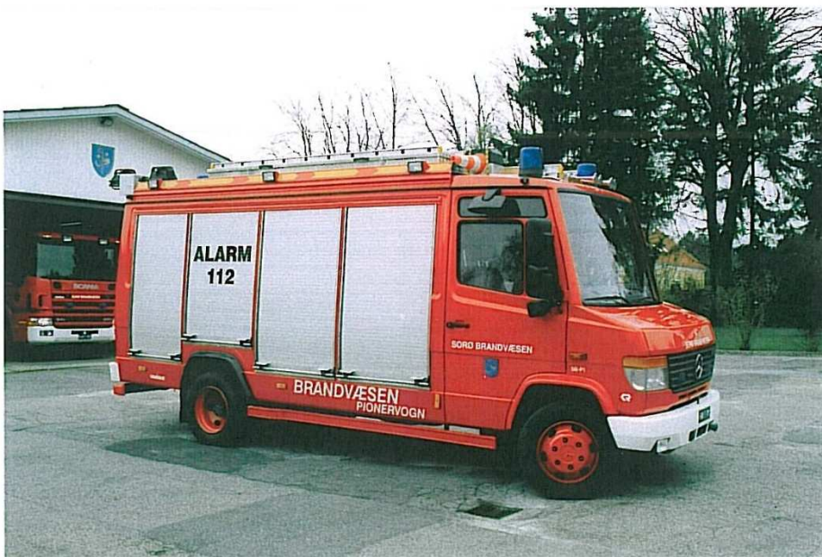
Sorø P-1, Mercedes Benz Vario