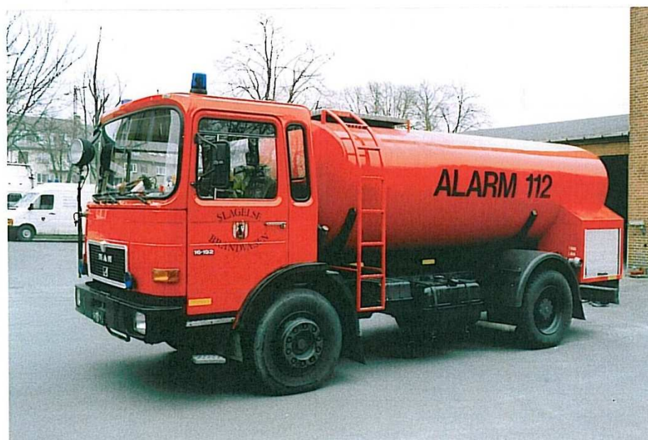
Slagelse V-1, MAN 16.192 F fra 1989.