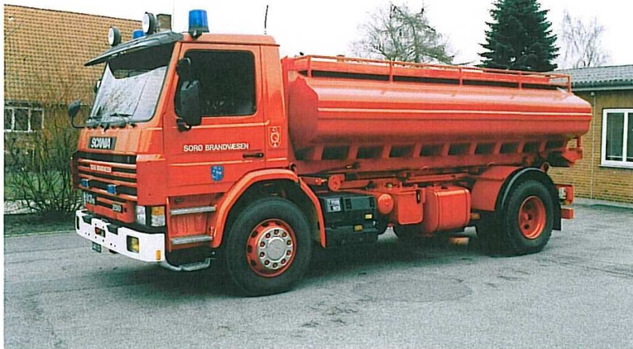
Sorø T-3, Scania 93M.