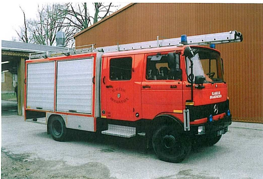
Slagelse M-1, Mercedes Benz 913 fra 1984.