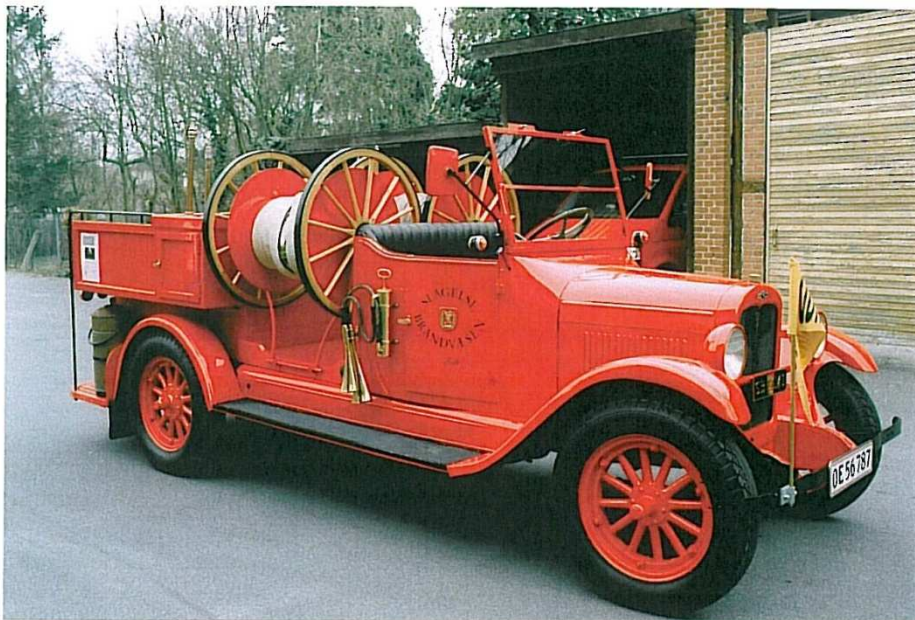
"Lotte" er Slagelses første autosprøjte, Chevrolet fra 1927.