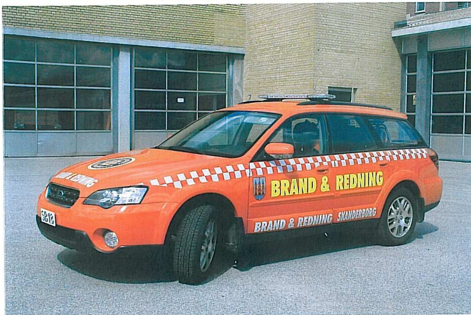
Skanderborgs ISL, SB 18. Subaru Outback 2,5i fra 2006.