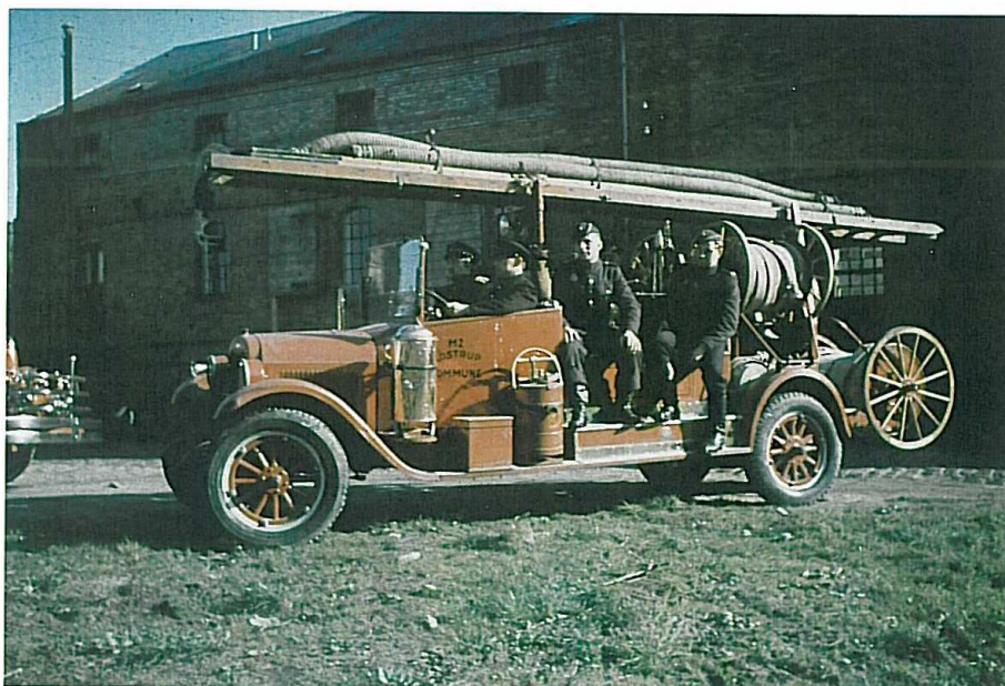
Glostrups Brandvæsens første motorsprøjte M-2, en Chervrolet fra 1927 her fotograferet under krigen med CB-mandskab.