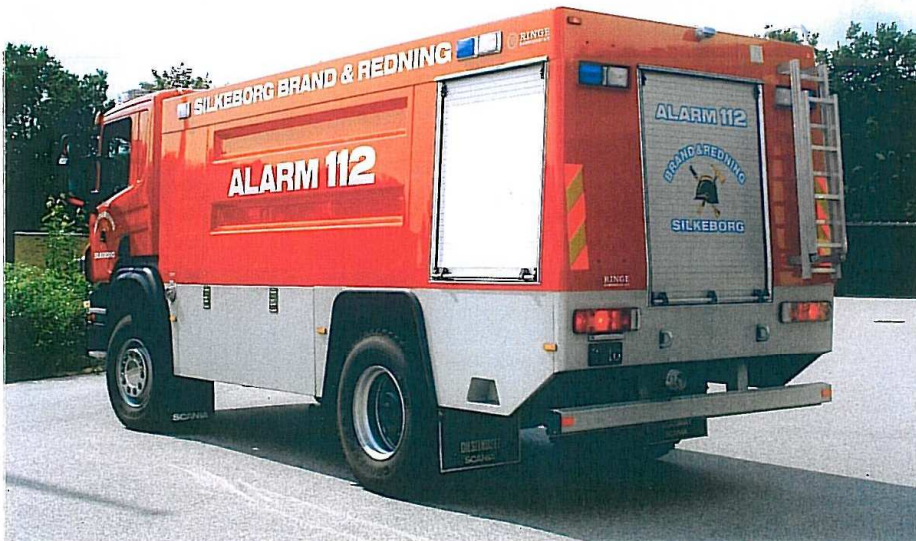
opbygget på et Scania P380 4x4 chassis.