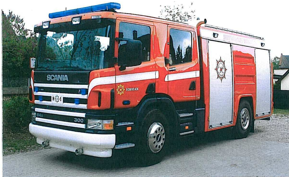
Nordsjællands Brandvæsen, Station Hornbæk. M-6.