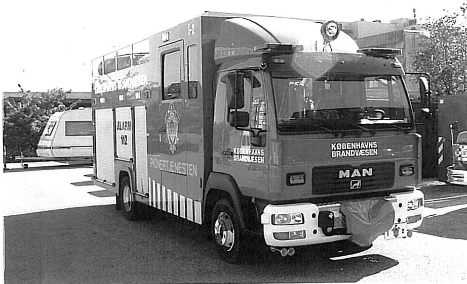
Københavns Brandvæsens nye I-2.