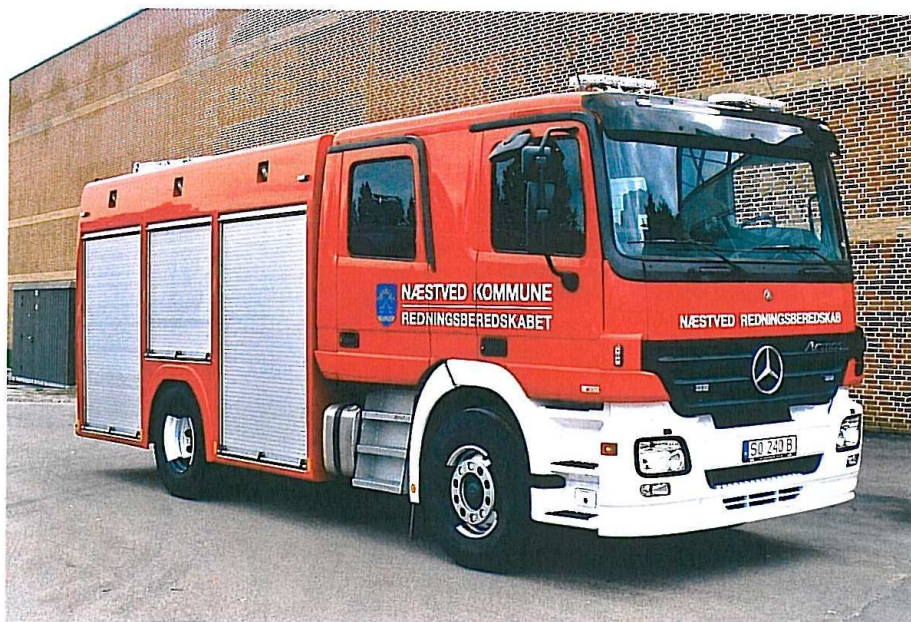
Næstved, MB 1832 Actros 4x4, WISS, Ruberg R30-pumpe, 3000 l. tank, 2 x 90 m HT.