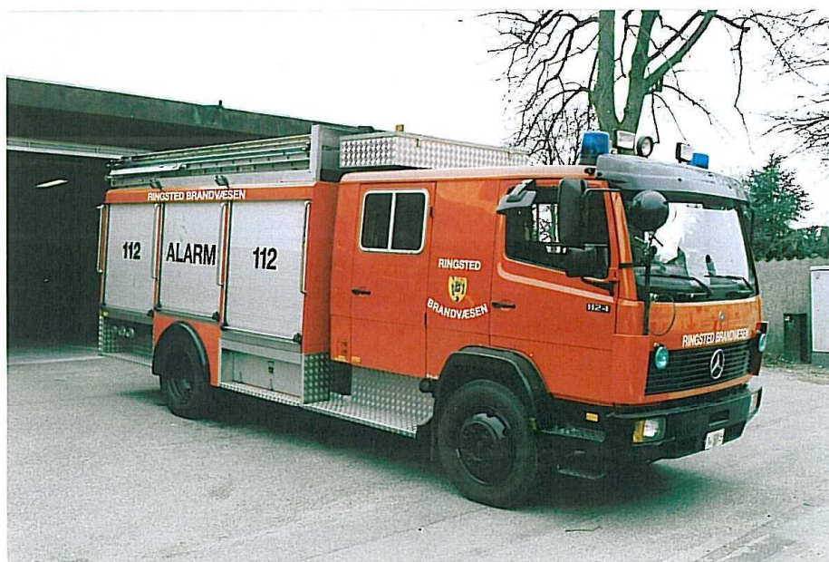
Ringsted M-5. Mercedes Benz 1124. Leveret i 1993 af Apollo Brandmateriel med en Ziegler pumpe og 1800 liter vandtank.