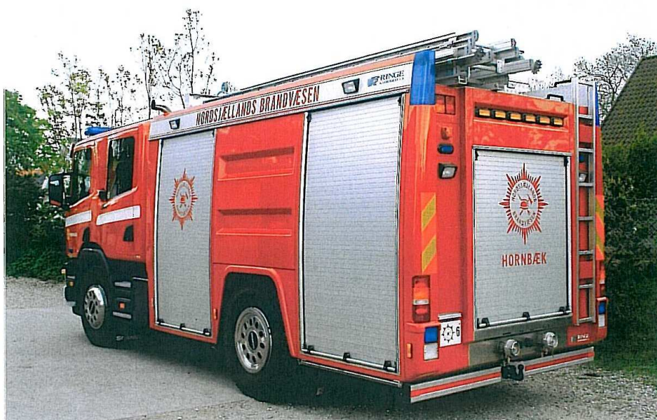
Opbygget af HMK Ringe (RK-4000 TSP)