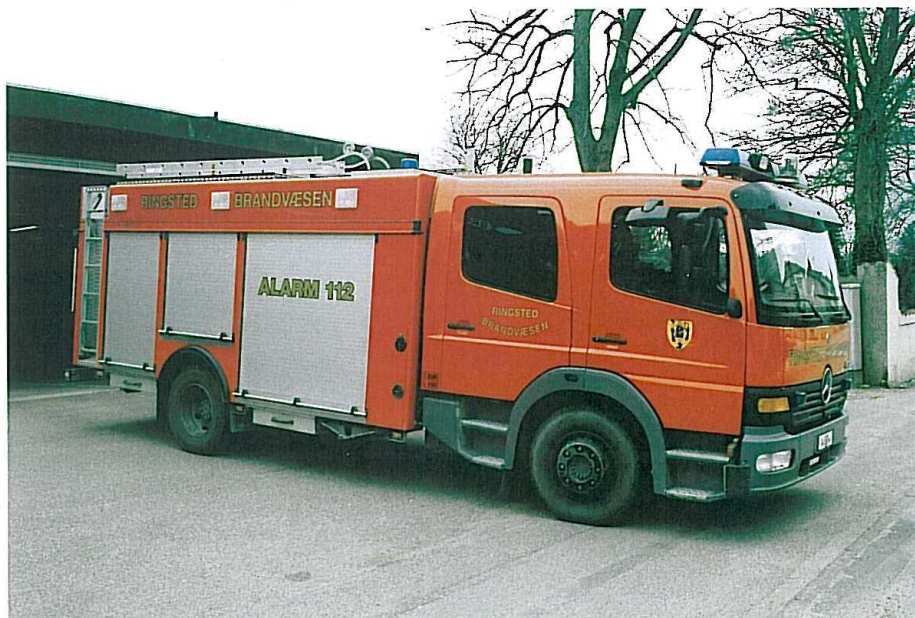
Ringsted M-6. En Mercedes Benz 1324 Atego. Vandtank på 2200 l og en Ruberg pumpe på 3000l/m. Leveret af Hauberg Technique i 02.