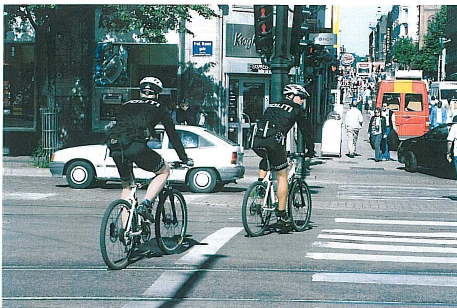
Vi springer fra Ringsted til norsk cykelpoliti i Oslo.