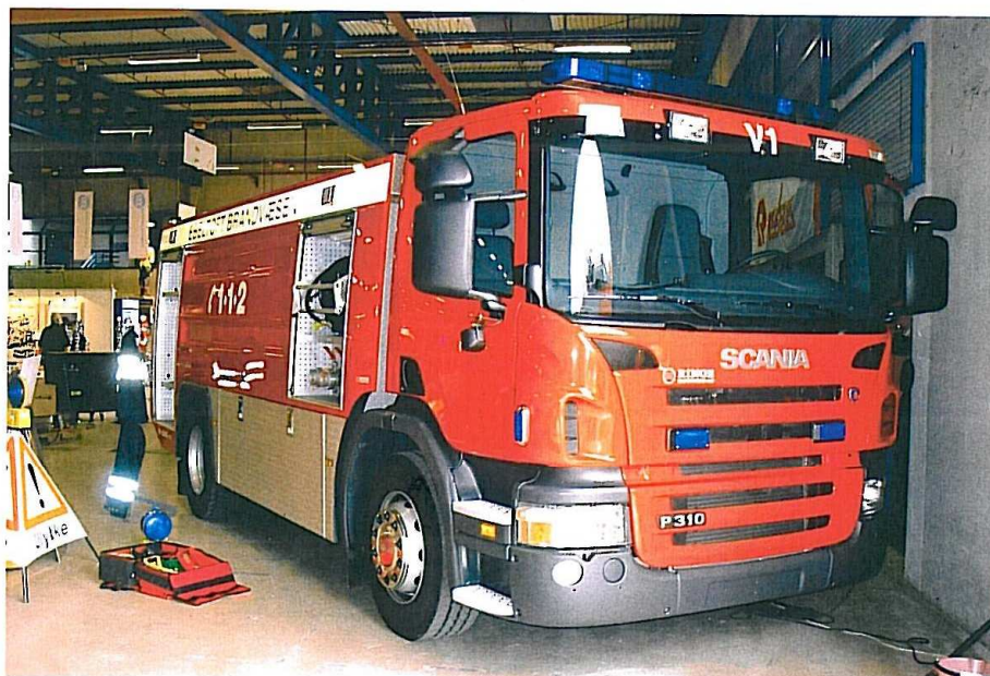
Ebeltoft V 1, HMK Ringe Karrosseri, Rosenbauer-pumpe, 8500 l. tank.