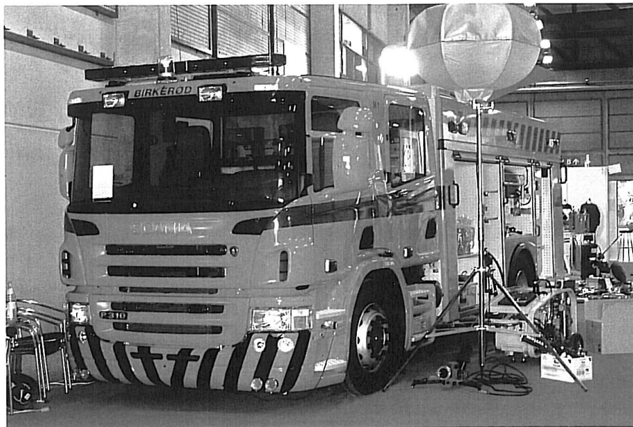
Birkerød M 1, Autokarross, Ruberg R30-pumpe, 2200 l. vandtank, 2 x 90 m HT.

Ellers kunne køretøjsentusiaster – og alle andre besøgende, selvfølgelig – besigtige den første danske redningslift model B 32 fra tyske Metz. Det bliver spændende at se, om B 32 bliver en lift man kommer til at se mere til i Danmark, hvor de finske producenter Bronto og Vema ellers har været enerådende.