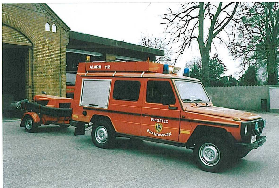
Ringsted ST-3 Mercedes Benz 300 GD med P-5 efter sig.