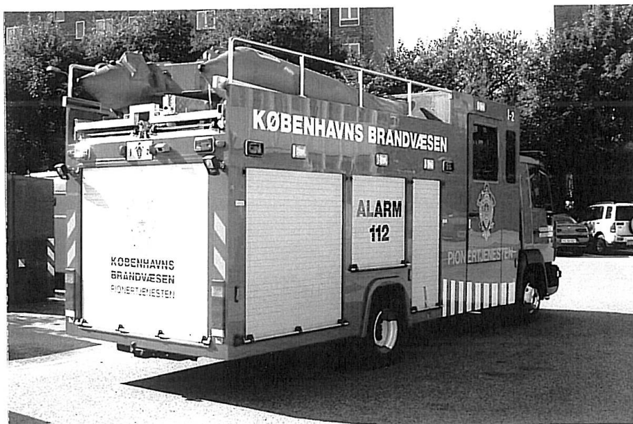
Vi håber på at bringe mere om dette køretøj i 4/06.