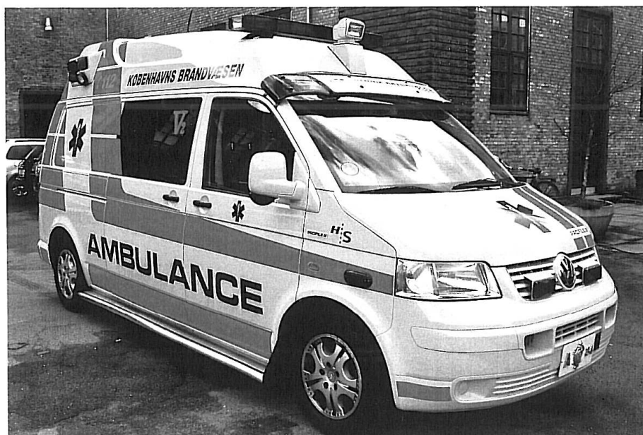
København A 34, VW T5 TDI, årgang 2005.

Den færdige model kan ses hos Stoppel Hobby, Grundtvigsvej 15, Frederiksberg til engang i oktober 2006.