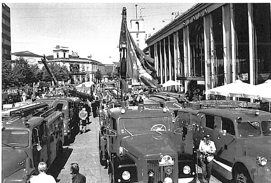
Ruten førte køretøjerne over Øresundsbroen og via Amager til Akseltorv i København og tilbage igen.