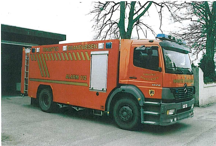
Ringsted T-3. Mercedes Benz 1828 Atego. Er i 2004 leveret af Hauberg Technique med Ruberg pumpe og 9000 liter vandtank.