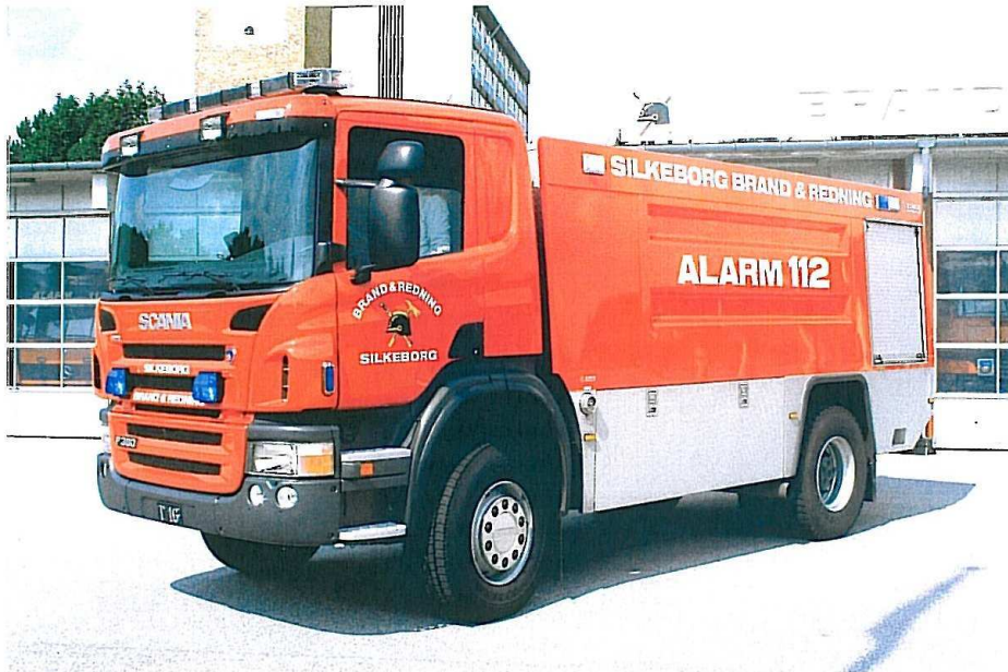
Silkeborgs nye tankvogn T-16 leveret af HMK Ringe (RK-8000 VTV) og er