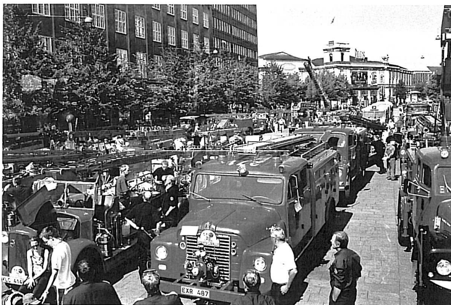
Lidt billeder fra Veteranbrandbilsrally som den 29 juli bragte disse mange køretøjer til Axeltorv i København.