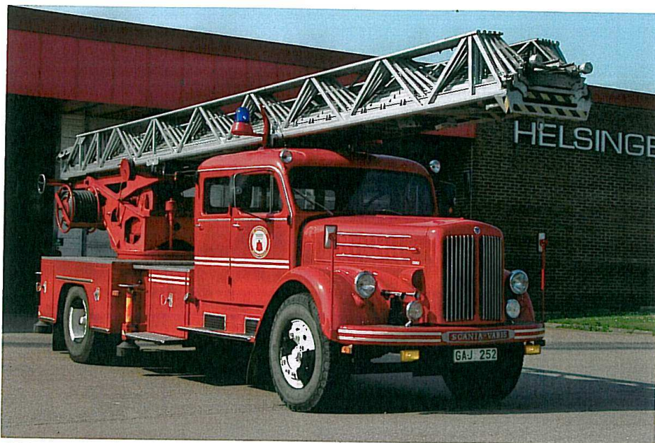
Lidt Scania af ældre dato fra Helsingborg Brandvæsen.