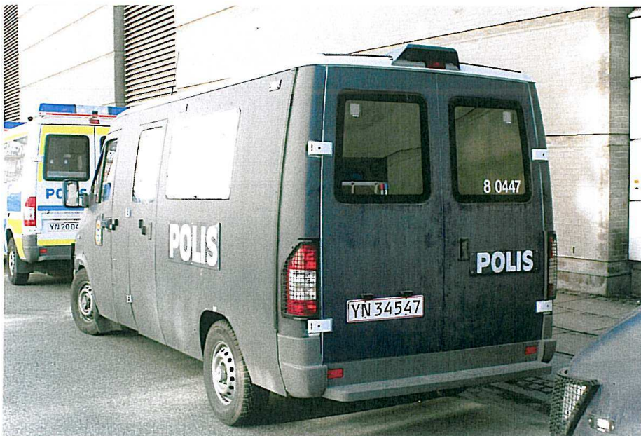
Her set bag fra.