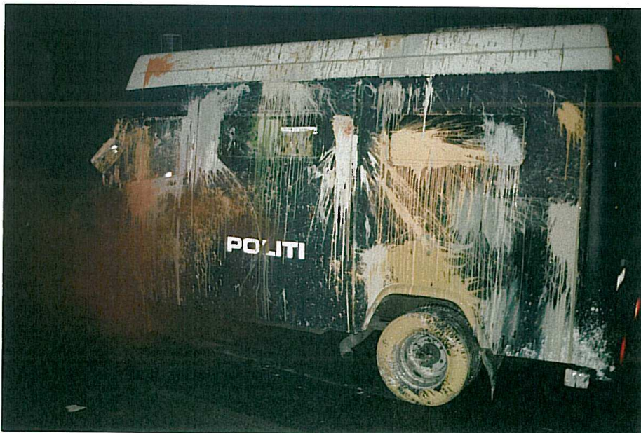
Jagtvej, 16 december 2006