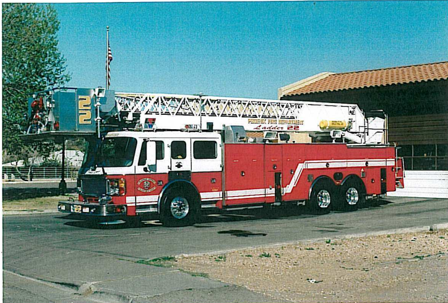
Phoenix Fire Dept. L 22. American LaFrance fra 2001. Stigen går 26 meter op.