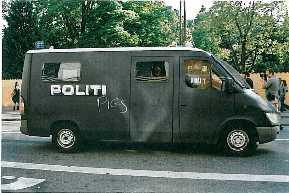
Lima 1 i "nyt" design på Nørrebrogade juni 2005.