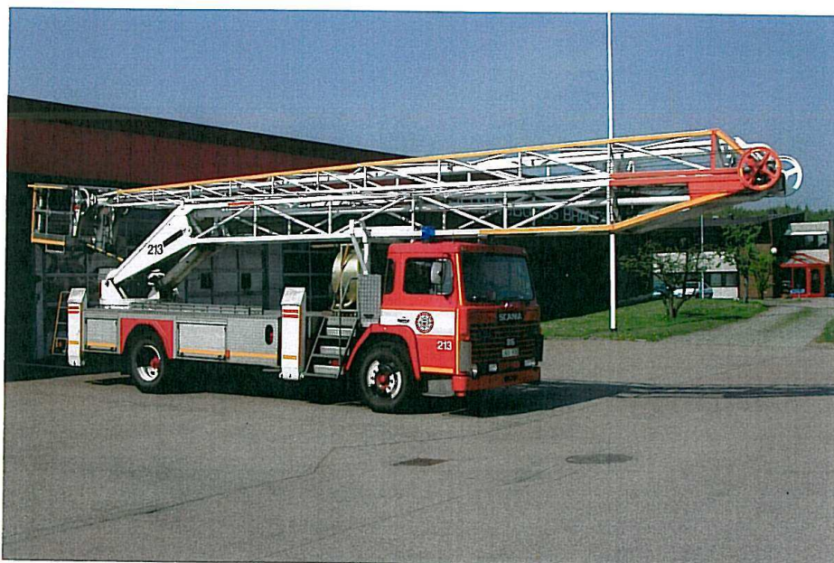
En Scania 86 med en Hi-Ranger.