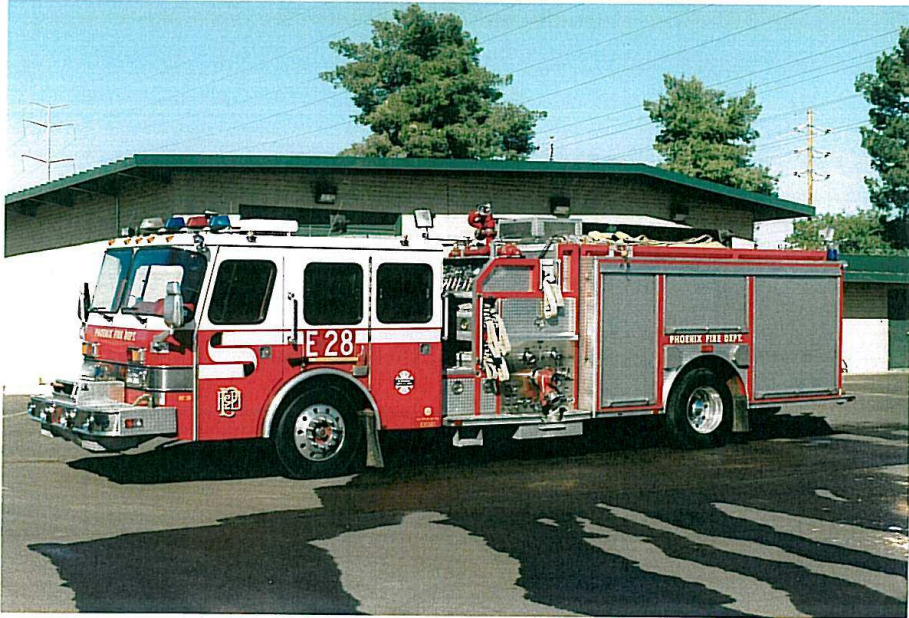
Phoenix Fire Dept. E 28. E-One fra 1992.