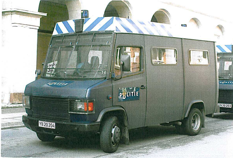
Politigården, en Hollændervogn fra Holland