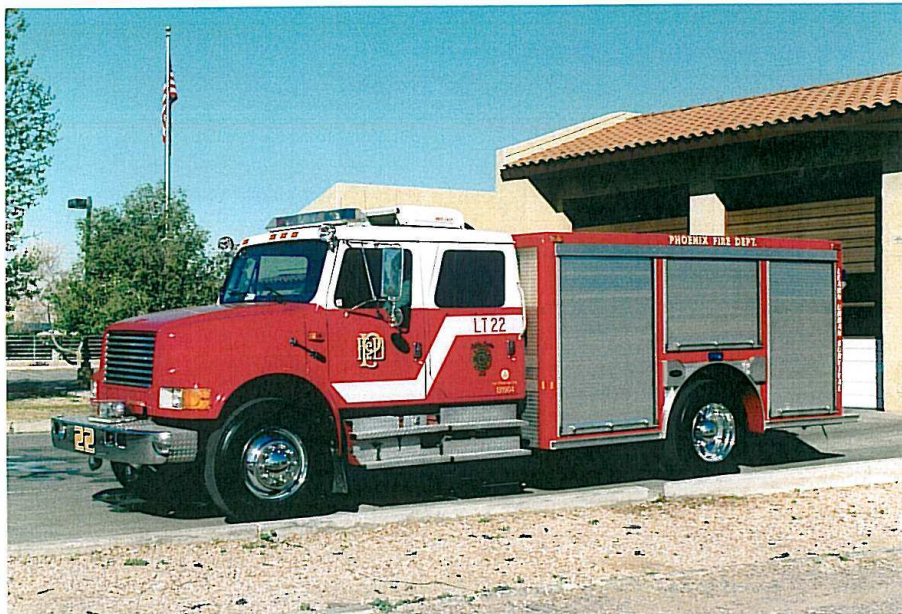
Phoenix Fire Dept. LT 22. IH/E-One fra 1991.