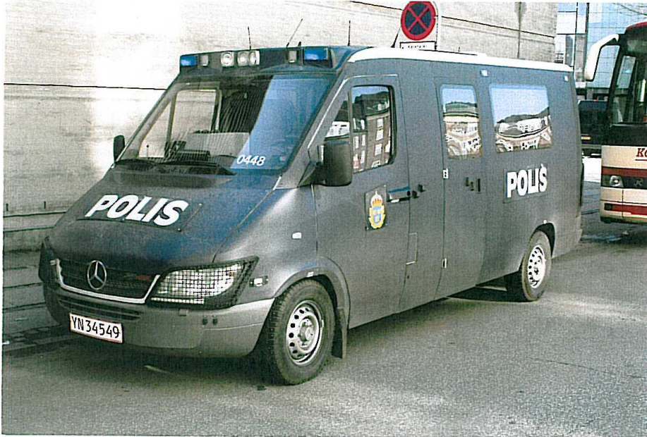
Politigården, et af de svenske bidrag