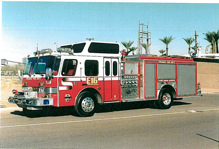
Phoenix Fire Dept. E16. E-One fra 1990.