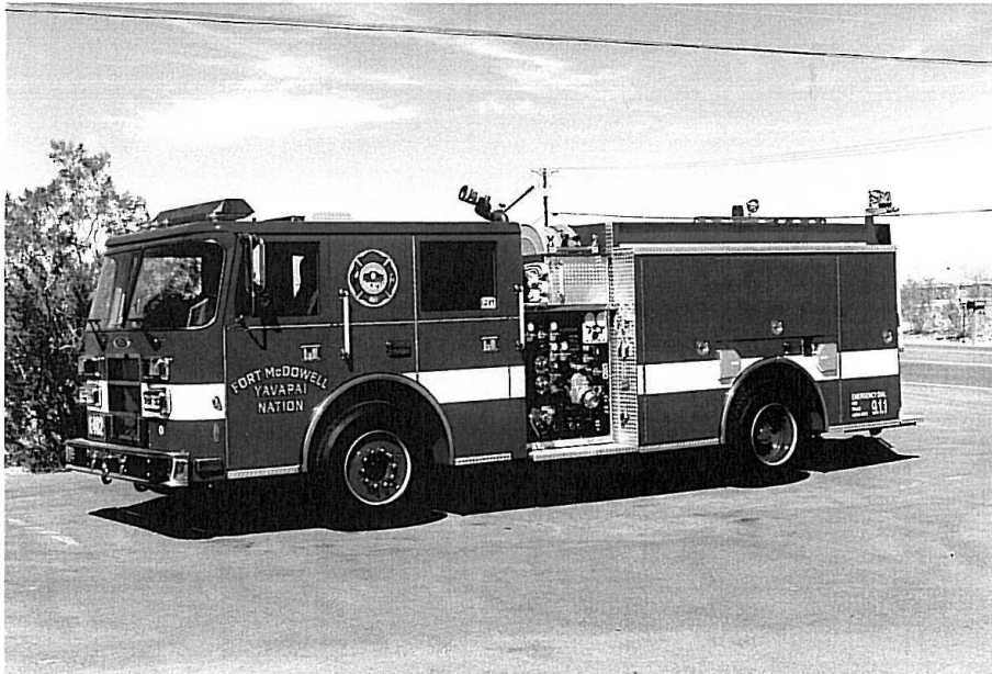
Fort McDowell, Yavapai Nation. En Pierce Contender fra 2000.

Stefan Farage fra New York har endnu engang sendt lidt billeder fra en af hans mange fototure rundt i USA, denne gang fra Arizona.