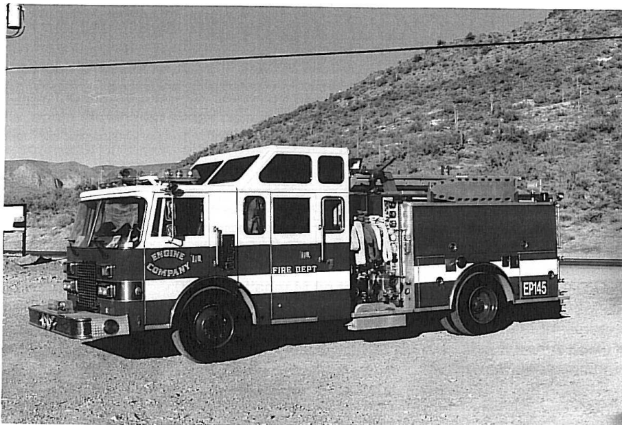
Tidligere Phoenix Fire Dept. nu Daisy Mountain.