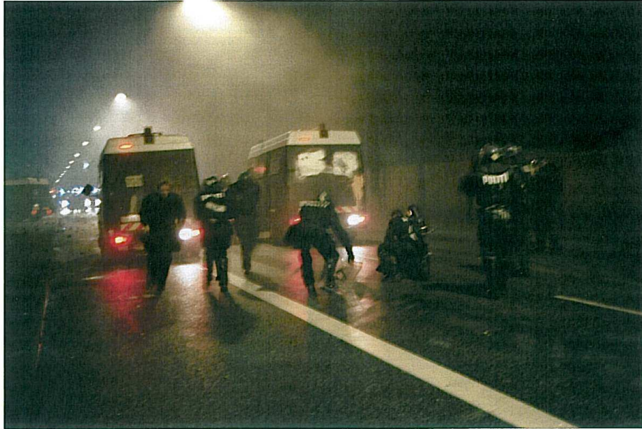
Jagtvej, 16 december 2006