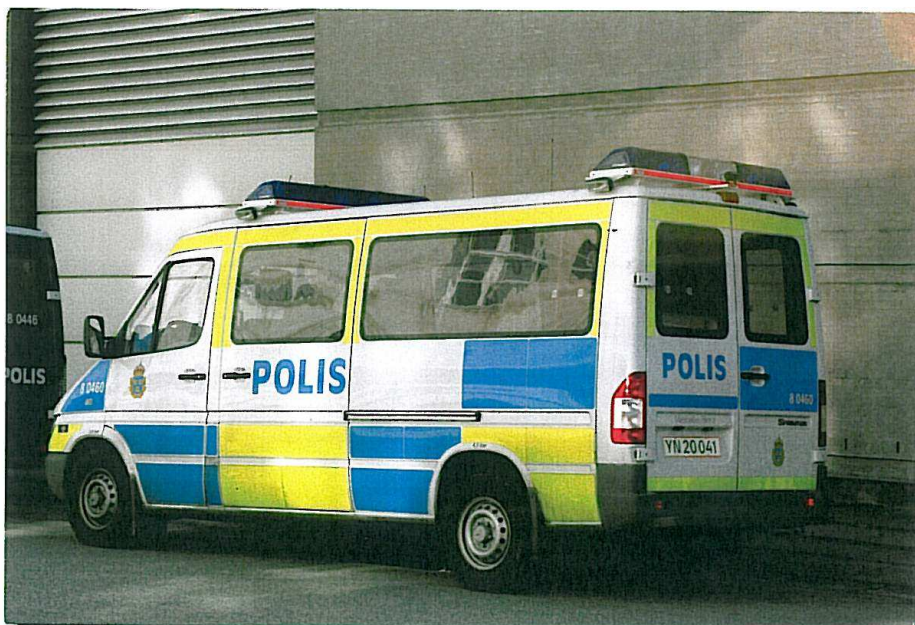
Politigården, forside bilen sat bagfra