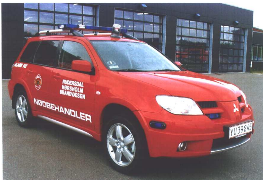
Rudersdal-Hørsholm Brandvæsen, station Hørsholm, akutenhed AE 1