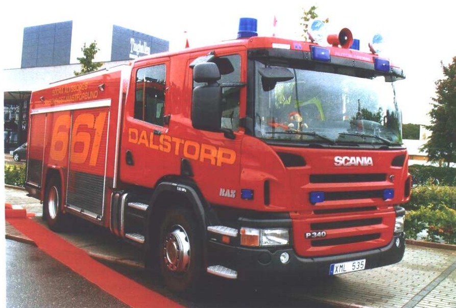
Södra Älvsborgs Räddningstjänstförbund, station Dalstorp, Autokaross