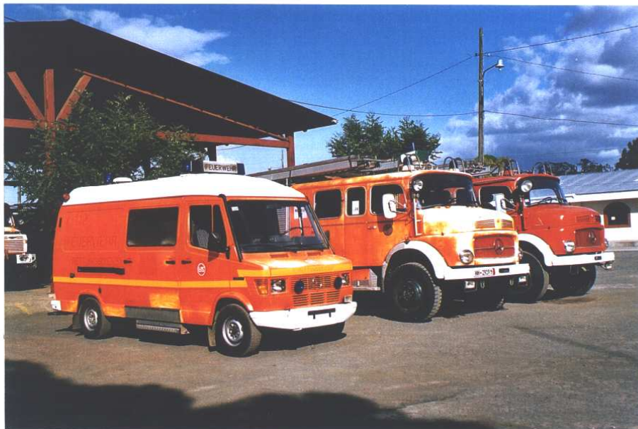
Gamle Hamburg-køretøjer i Leon, Nicaragua