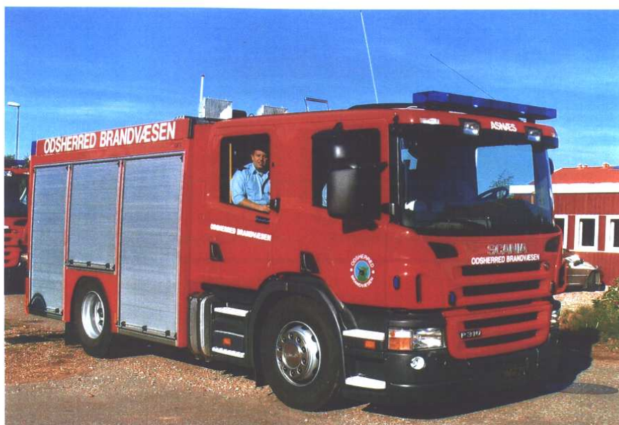
Odsherred Brandvæsen, station Asnæs, M 21.