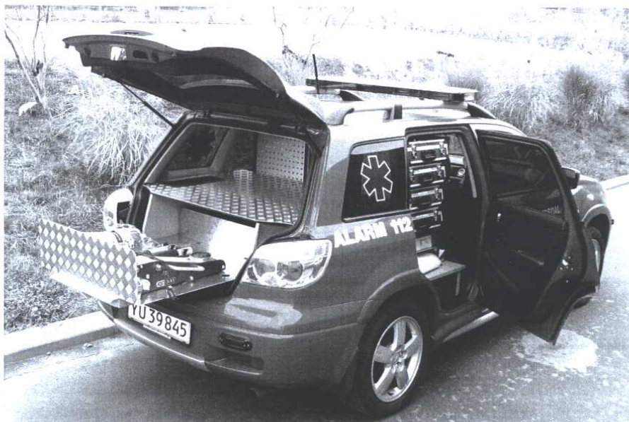
Rudersdal-Hørsholm Brandvæsen, station Hørsholm, akutenhed AE 1