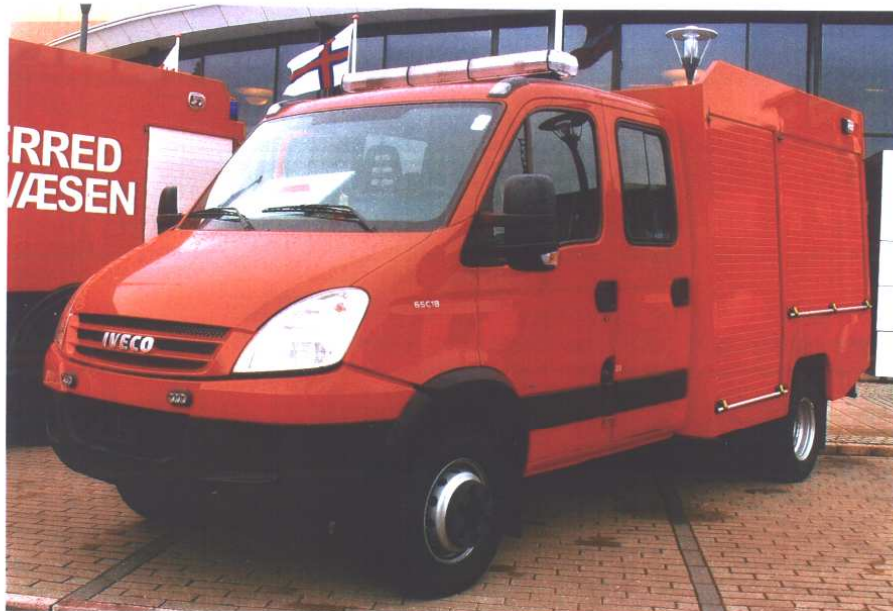
Mulig HSE/minisprøjte på IVECO fra SAWO