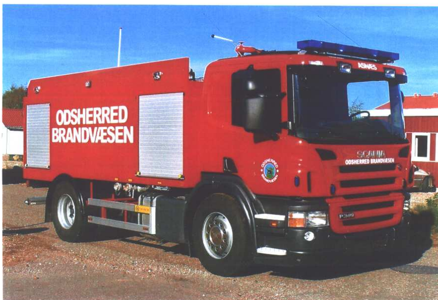
Odsherred Brandvæsen, station Asnæs, V 22.