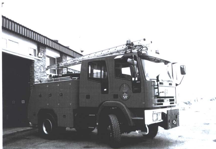
IVECO EuroCargo/Protec-Fire fra Monachil/Sierra Nevada