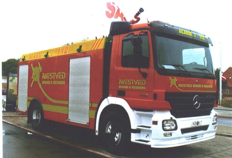
Næstved Brand & Redning, NB 17, MB 1832 Actros