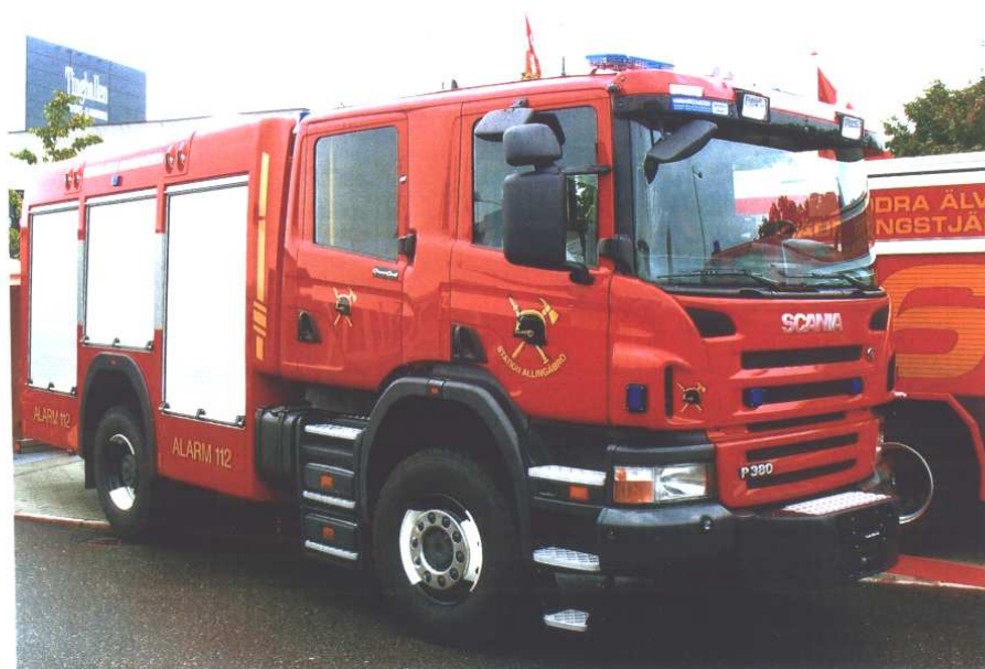
Norddjurs Brandvæsen, station Allingåbro, ny sprøjte fra Hauberg/WISS