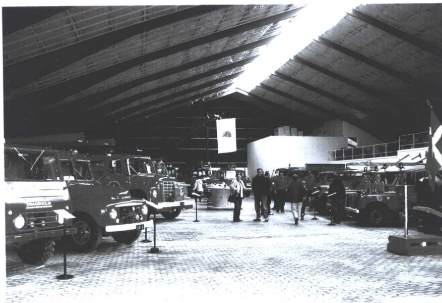
De mange utrolig velbevarede køretøjer kommer rigtig til sin ret!

Selve museet er indrettet i en nyopført hal med vinduesbånd og stort ovenlys, hvilket – i modsætning til rigtig mange andre museer – giver meget lyse og indbydende rammer. Der er god plads mellem køretøjerne på trods af at man oven i købet har fået tilgang af "nye" køretøjer for nyligt – herunder den netop pensionerede MB LP-sprøjte med H. F. Nielsen-opbygning fra Nykøbing-Rørvig, som senest har kørt som lånevogn i Asnæs indtil deres nye sprøjte kunne sættes i drift.