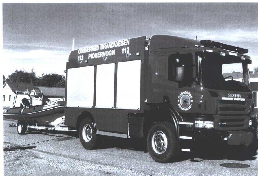
...og nye! Her Asnæs-stationens helt nye pionervogn, Scania P380/SAWO