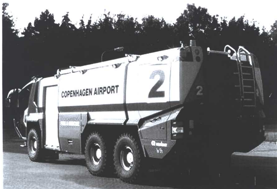
CPH "2" fotograferet ved leveringen.