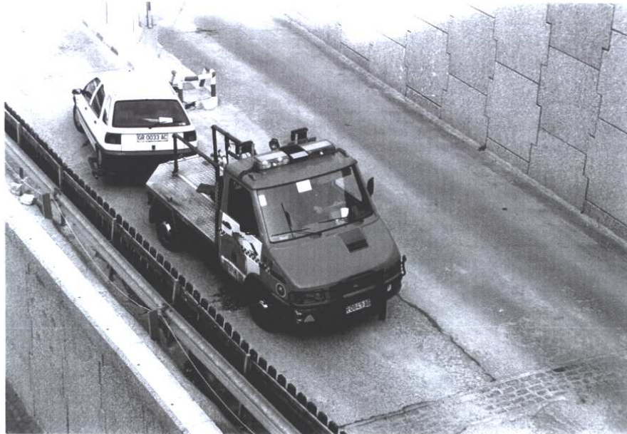
Sådan håndterer man PTU (parkering til ulempe) i Monachil