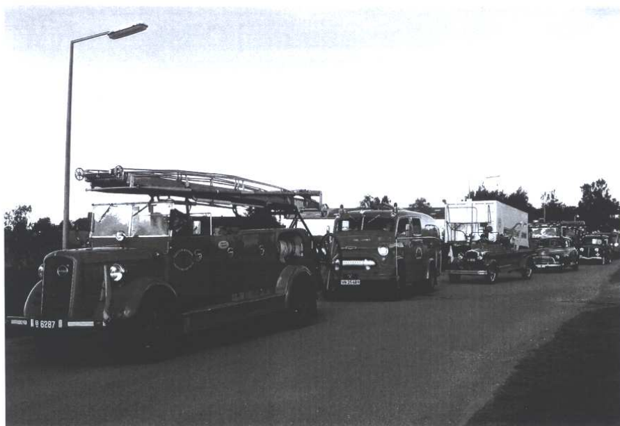
Der blev arrangeret optog gennem Asnæs med gamle brandbiler