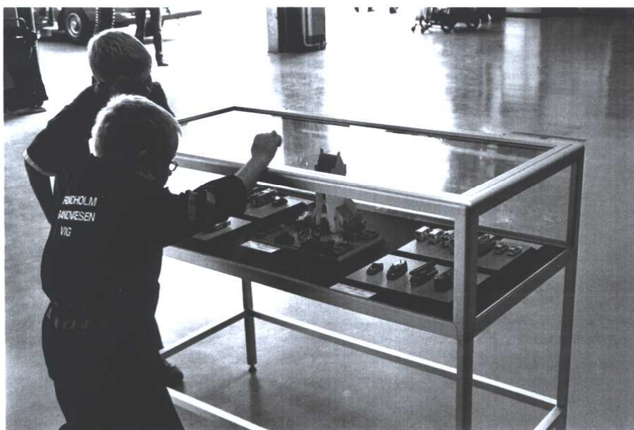
Fremtidens modelbyggere...? På Hørsholm brandstation 1/9 2007