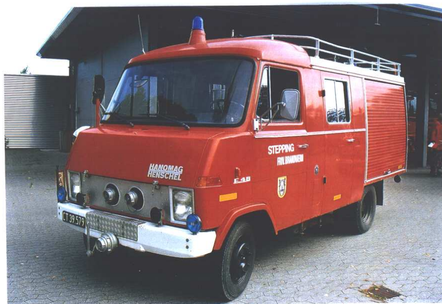
8/8-sprøjte fra Stepping Frivillige Brandværn ved Rudersdal-Hørsholm Brandvæsens 100 års jubilæum 1. september 2007