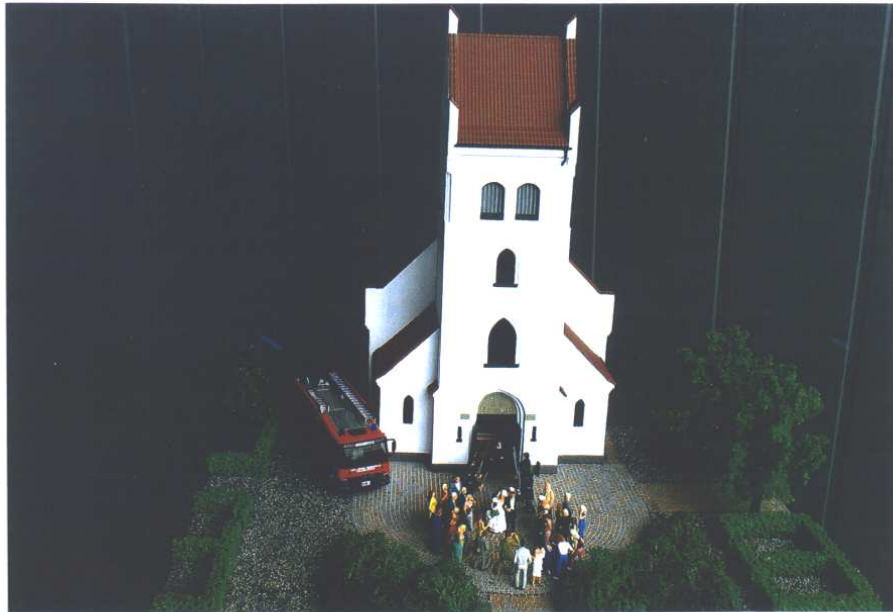
Nivå Kirke, Hørsholm M1 og en flok Preiser-mennesker i 1:87