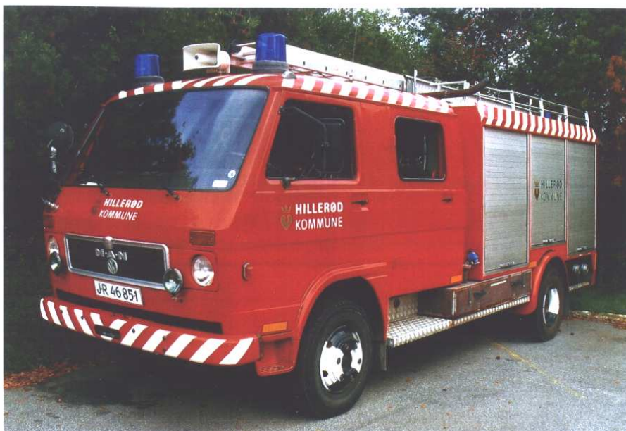
Sprøjte til de frivillige i Hillerød Kommune: MAN VW 9.136, årg. 1982, HFN