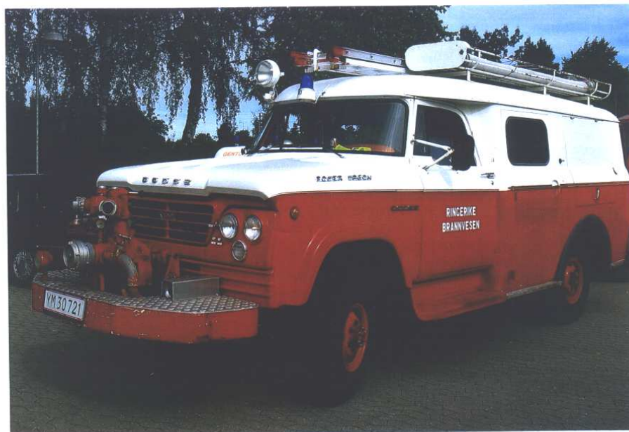
Peter Rasmussens flotte Dodge-sprøjte fra Ringerike Brannvesen (N).