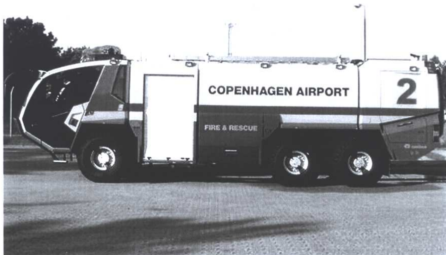
CPH "2" fotograferet ved leveringen.